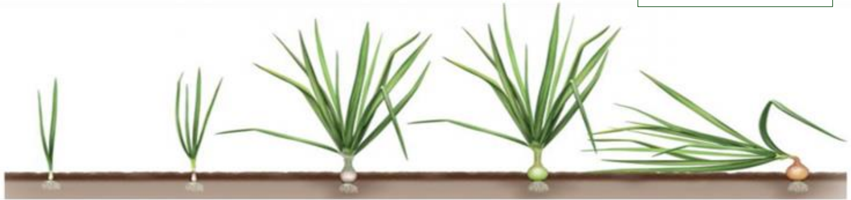
Ilustración SEQ Ilustración \* ARABIC 1: Etapas de crecimiento de la cebolla.